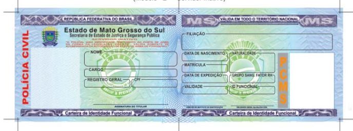
Anexo II (Modelo "B" - Servidor Inativo)